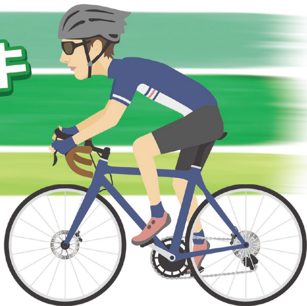
ブレーキキャリパー