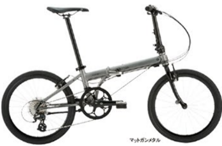
マッドガンメタル