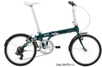
フォレストグリーン