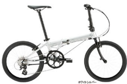
ホワイトシルバー