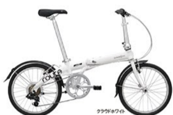
クラウドホワイト